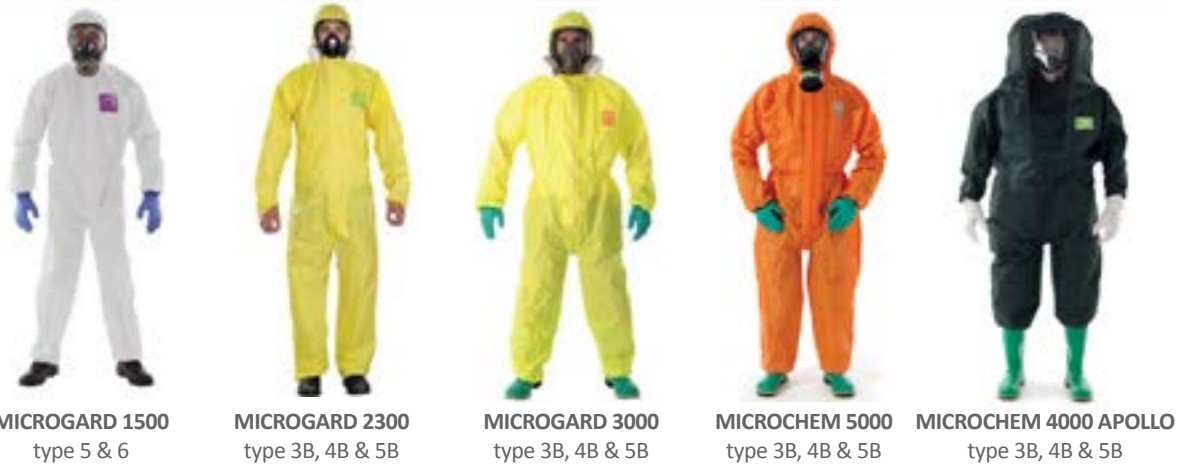
MICROGARD 1500 type 5 & 6