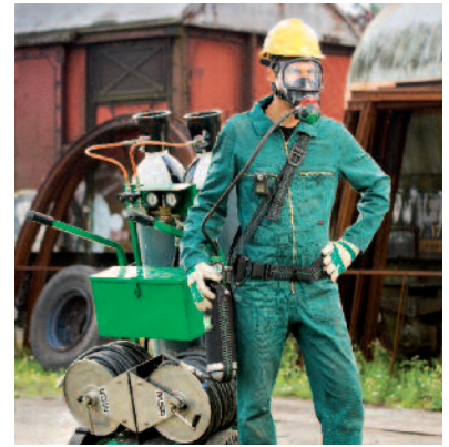
Combinatie van MASS-trolley en PremAire