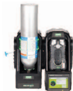
GALAXY GX2, geautomatiseerde testbank

Voor bump tests of kalibraties kunt u kiezen voor de GALAXY GX2, onze geautomatiseerde testbank, of om handmatig te testen met een reduceerventiel.