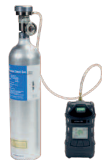
Handmatig testen met testgas