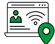
Safety io Grid-services