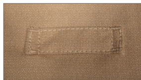
Multifunctionele houder voor lamp en andere tools