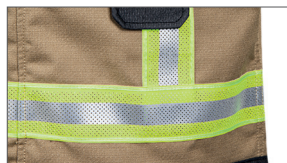
Gepereforeerde slijtvaste signalisatiebanden