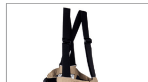
Afneembare, regelbare bretellen