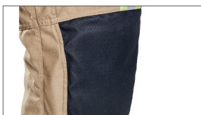
Ingewerkte ergonomische kniestukken